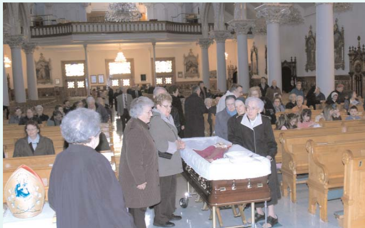
Des fidèles s'arrêtent un dernier moment auprès du défunt avant la célébration.

La veille, en après-midi, Mgr Sanschagrín reposait au Grand salon de l'évêché. La famille de Mgr Sanschagrín a pu se retrouver avant l'ar-