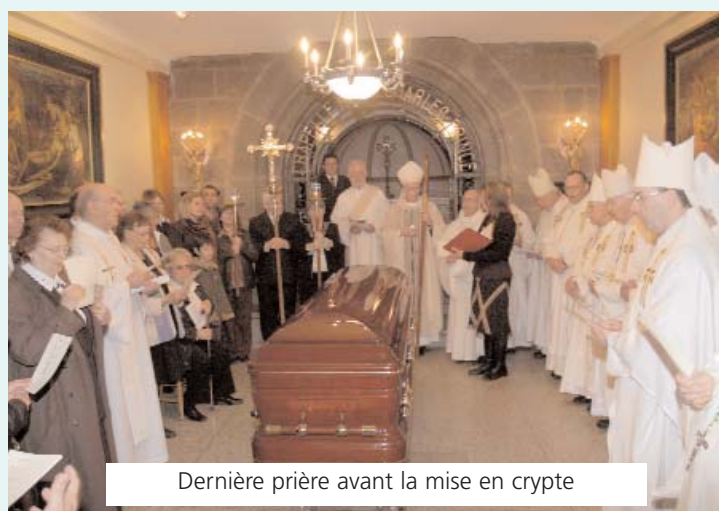
Dernière prière avant la mise en crypte