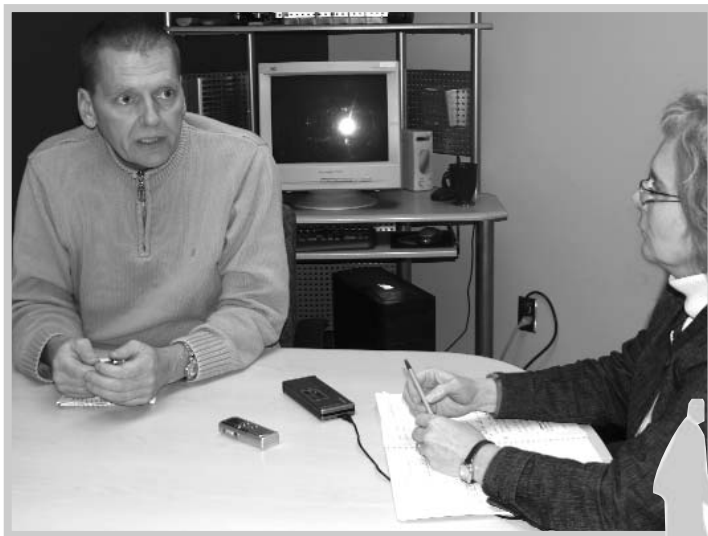
Propos recueillis par Claire Dumesnil