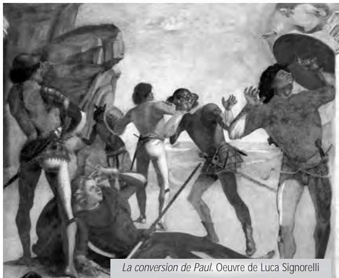
La conversion de Paul. Oeuvre de Luca Signorelli

Vous savez avec quelle violence je faisais souffrir l'Église de Dieu et voulais la détruire. (...) Mais Dieu m'a choisi dès le ventre de ma mère et, dans sa bonté, il m'a appelé. Un jour il a décidé de me faire connaître son fils pour que je l'annonce à ceux qui ne sont pas juifs. » (Ga 1,13-16).